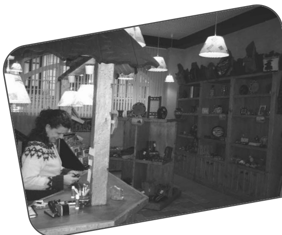
kidenda - C/ Padre Lojendio, 2 - Bajo. Bilbao