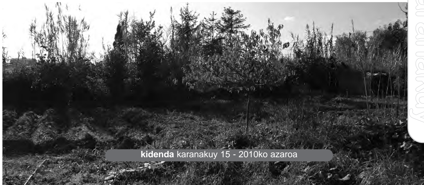
kidenda karanakuy 15 - 2010ko azaroa