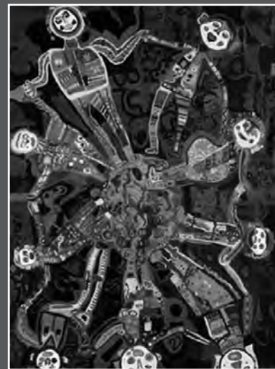
Niños Jugando" por Niños Mayas (Quintana Roo, México)

Para realizar mejor el debate lo más conveniente es ofrecer información sobre las condiciones de trabajo en los países del Sur y del Norte. Ayudarles a diferenciar que el lugar de procedencia de un producto no implica condiciones justas o injustas de trabajo directamente. Es una buena oportunidad para invitar a los participantes a interesarse por temas como el Comercio Justo.