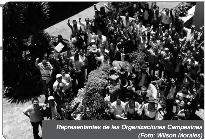
Representantes de las Organizaciones Campesinas

MCCH-ek hainbat garapenerako proiektu bultzatzen du Ecuadorren hango nekazarien bizi baldintzak hobetzeko.