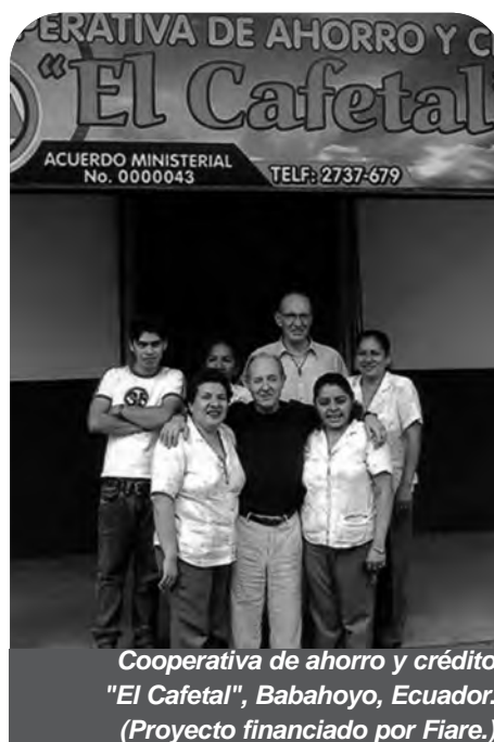
Cooperativa de ahorro y crédito "El Cafetal", Babahoyo, Ecuador. (Proyecto financiado por Fiare.)