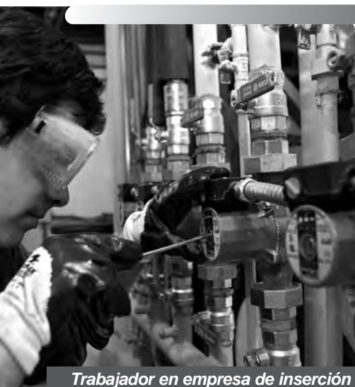
Trabajador en empresa de inserción

Erlazio ekonomiko solidariagoak eta arduratsuagoak bultzatzen dituzten ekimen ekonomikoak egon badaude.